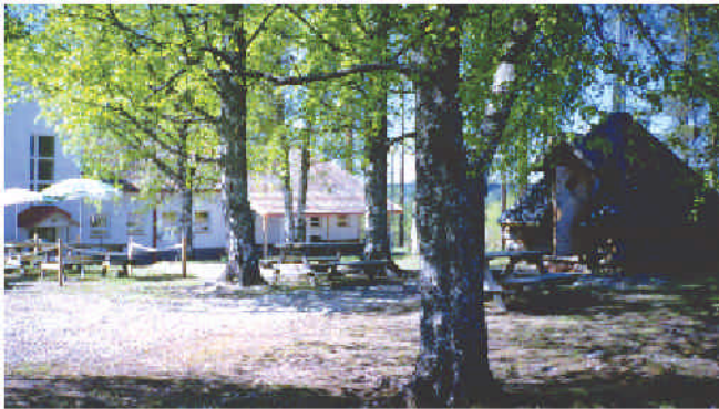
30 Betten in der Jugendherberge Erämatkailukeskus Käenkoski Naarvantie 194 B, 81460 KÄENKOSKI kaenkosken.era@co.inet.fi