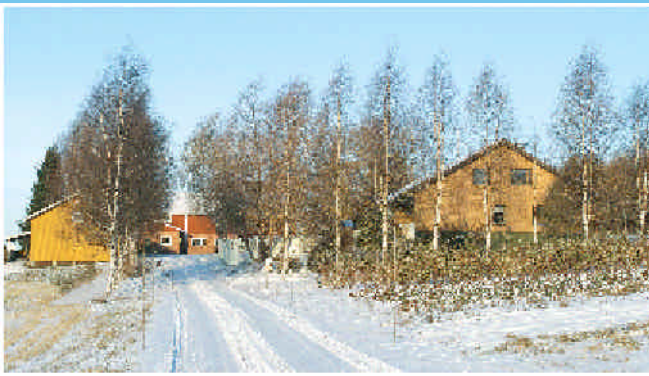
30 Betten auf dem Bauernhof Anssilan maatila Anssilantie 7, 82900 ILOMANTSI anssila@ilomantsi.com