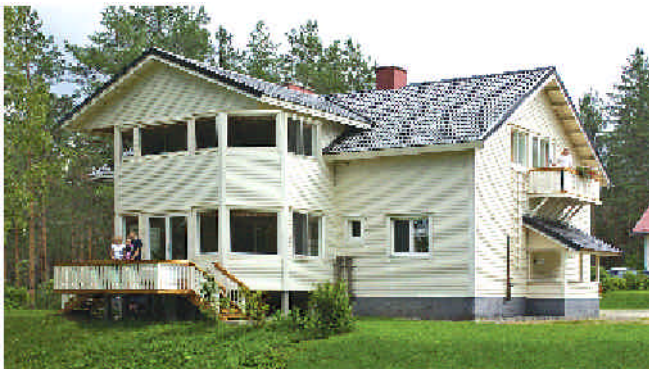
20 Betten in einem Apartmenthotel Möhkön Rajakartano Möhköntie 219, 82980 MÖHKÖ tesveka@sci.fi